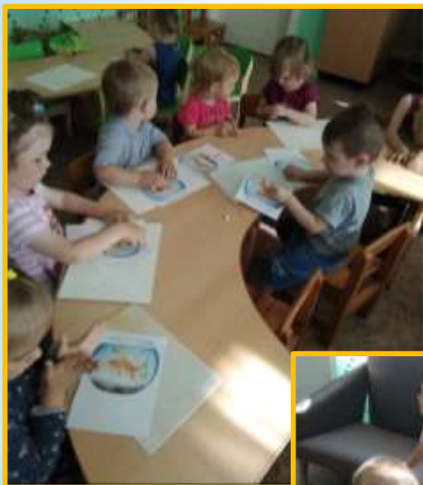
Лепка барельефная «Корм для рыбки»